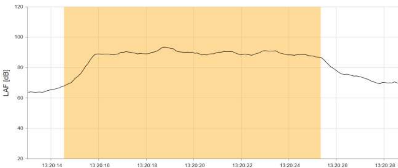
Abbildung 2.1: Pegelverlauf der Güterzugvorbeifahrt mit v = 91 \text{ km/h} an der Messstelle Andernach am 10.12.2024, 13:20:15 Uhr (Quelle https://www.laerm-monitoring.de/zug?mp=8 )

Dass damit die Geräuschbelastung bei der Vorbeifahrt von Güterzügen sinkt, ist aber nicht immer gewährleistet. So zeigt beispielsweise eine aktuelle Güterzugvorbeifahrt ( v = 91 \text{ km/h} ) an der Messstelle Andernach des bundesweiten Lärm-Monitorings am 10.12.2024, 13:20:15 Uhr einen Pegelverlauf, der fast über die gesamte Vorbeifahrtzeit 90 \text{ dB(A)} übersteigt, mit einem Maximalpegel von 93,4 \text{ dB(A)} (siehe Abbildung 2.1). Der auf 80 \text{ km/h} normierte Transit Exposure Level TEL80 (gemittelter Pegel inklusive der An- und Abstiegsflanken) beträgt 87,9 \text{ dB(A)} , damit knapp 2 \text{ dB(A)} über der Schwelle, die das Eisenbahn-Bundesamt zur Unterscheidung von lauten und leisen Güterwagen benutzt. Geht man davon aus, dass – wie in diesem Newsletter berichtet (siehe Beitrag 2.8, Jahresbericht) – nur noch 0,03 \% der Wagen in Deutschland mit Graugussklötzen unterwegs sind, dann muss die relevante Pegelerhöhung durch schlechte Wagen- oder Schienenqualität verursacht sein (in diesem Fall eher durch schlecht gewartete Wagen, da die leisesten Güterzüge in Andernach auf einen TEL80 von knapp über 75 \text{ dB(A)} kommen). Der ALD hat schon des Öfteren darauf verwiesen, dass die Wartung der Fahrzeuge und der Schienen unbedingt verbessert werden muss, um das volle Minderungspotenzial durch das Betriebsverbot der GG-Güterwagen zu nutzen.