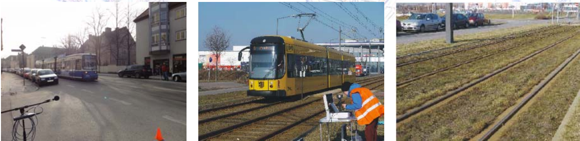
Abb. 1. Gleisarten. Links: Feste Fahrbahn, Mitte: Betonschwellen/Schotter, Rechts: Rasengleis

Drei Gleisarten waren vertreten: Feste Fahrbahn, Schotterbett mit Betonschwellengleis und Rasengleis (Abbildung 1).